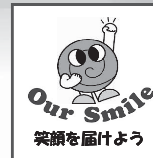
ぐるぐる京葉募金箱

地域づくり団体のメンバーがそれぞれ協力店舗を開拓し、募金箱の設置を呼びかけています。