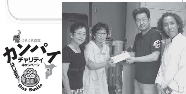
「カンパイチャリティ」協力店舗から寄付を受け取る「こころの相談室・いちばら」

〈キャンペーンの流れ〉 参加店舗の募集→店舗ごとにチャリティメニューと寄付先団体を決定→キャンペーン実施→団体への寄付→団体から寄付報告