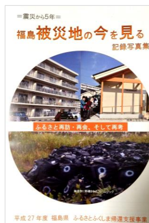
平成27年度福島県ふくしま帰還支援事業 記録写真集